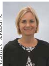
Leitung der Nachwuchsakademie