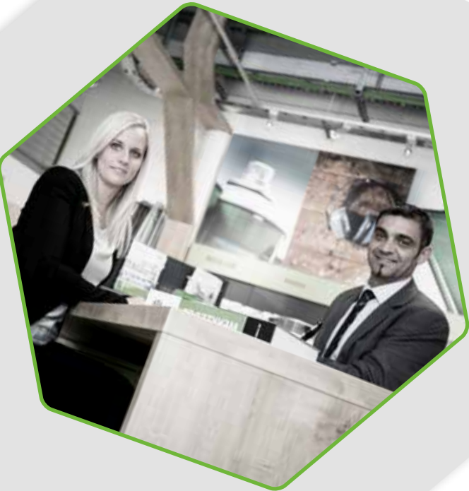
Executive Vice President RECA Group, Vorstandsvorsitzender Kellner & Kunz AG