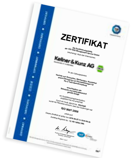
Leitung QS, Kellner & Kunz AG