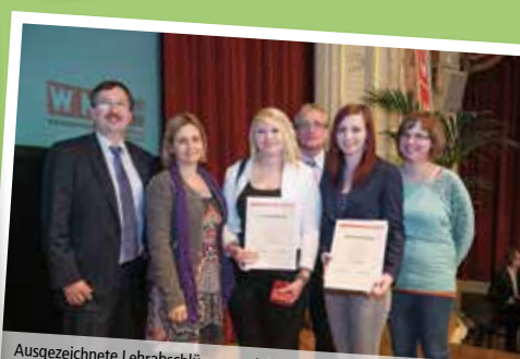
Ausgezeichnete Lehrabschlüsse werden von der Wirtschaftskammer geehrt.