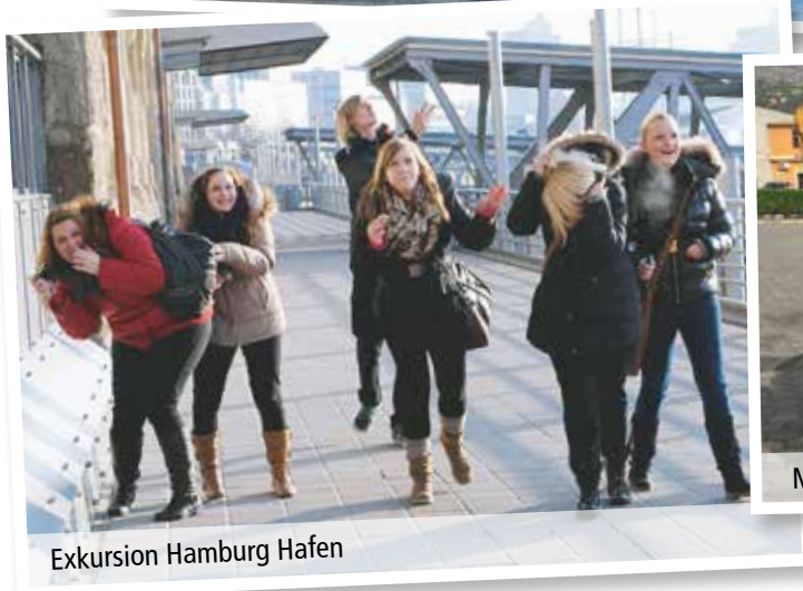
Exkursion Hamburg Hafen