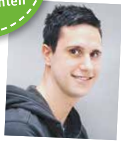
NAK-Absolvent 2010, operativer Facheinkauf