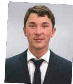
NAK-Absolvent 2011, Verkauf Handwerk Außendienst