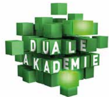
Trainees der Dualen Akademie