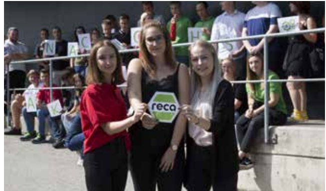
Lehrlingsfrühstück: Das Amt der Lehrlingspräsidentin wurde übergeben.