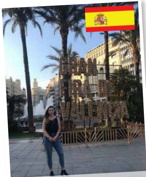
Duale Akademie in Valencia

Unter anderem werden auch studierende Ex-Lehrlinge bei ihren Auslandsaufenthalten wie z.B. in Kanada unterstützt.