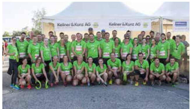
Welscher Business-Run: Dieser Lauf/Walk ist ein tolles Gemeinschaftserlebnis. Die sportlichen Lehrlinge sind natürlich auch dabei.