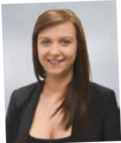
NAK-Absolventin 2014, JWD Innendienst Verkauf