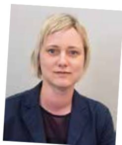
Vom Lehrling zur strategischen Einkaufsspezialistin; seit 1996 Kellner & Kunz