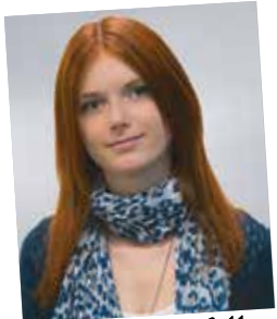
NAK-Absolventin 2011, Industrie Wien, Lehrlingsausbilderin