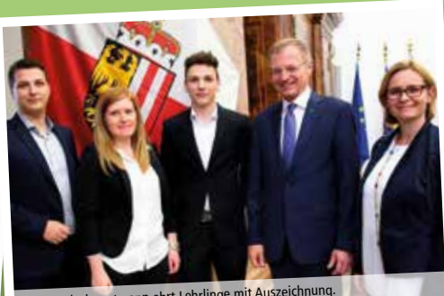
Der Landeshauptmann ehrt Lehrlinge mit Auszeichnung.