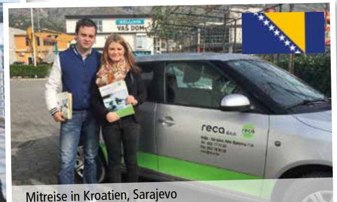
Mitreise in Kroatien, Sarajevo