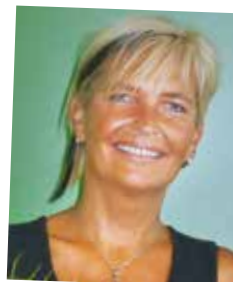
Vom Lehrling zur Leiterin Abteilung i-Punkt/Logistik; seit 1988 Kellner & Kunz