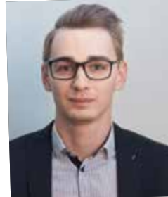
NAK-Absolvent 2009, Regional-Verkaufsleiter Industrie