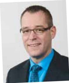
Vom Lehrling zum Einkaufsleiter, Logistik-Leiter und Vorstand; seit 1986 Kellner & Kunz

1922 gegründet, setzt die Kellner & Kunz AG schon seit Jahrzehnten auf kompetente MitarbeiterInnen, die in der Firma als Lehrlinge ausgebildet werden und in weiterer Folge als Fachspezialisten, Abteilungsleiter oder Sachbearbeiter Karriere machen. Lehrlingsausbildung ist bei Kellner & Kunz Chefsache, Unternehmensstrategie und gelebte Firmenkultur. Seit 2005 gibt es zusätzlich zur herkömmlichen Lehrlingsausbildung die interne Kellner & Kunz-Nachwuchsakademie zur optimalen Förderung unserer Lehrlinge. Derzeit sind rund 30 Lehrlinge in diesem Ausbildungsprogramm.