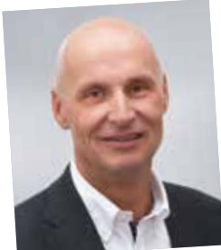
Vom Lehrling zum Top-Industrie-Verkäufer; seit 1979 Kellner & Kunz