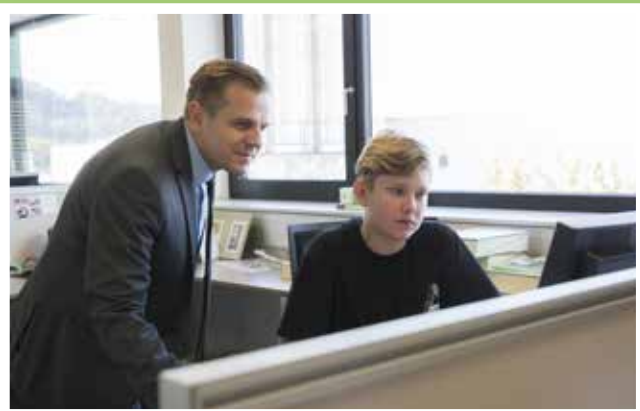
E-Commerce-Kaufmann bei der Arbeit