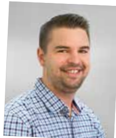
NAK-Absolvent 2010, Innendienstbetreuer der Keyaccount/Kunden CO