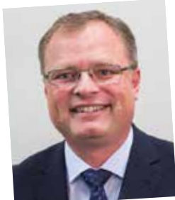
Vom Lehrling zum Topkey Account-Verkäufer; seit 1986 Kellner & Kunz