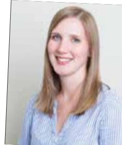
NAK-Absolventin 2013, JWD Innendienst Verkauf