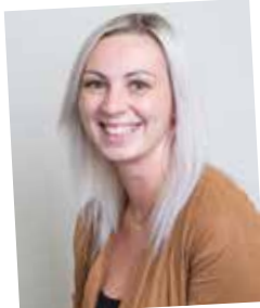
NAK-Absolventin 2014, JWD Innendienst, Verkauf