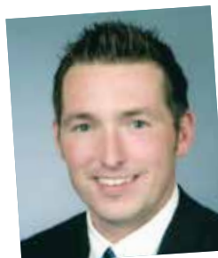
Vom Lehrling zum Top-Industrie-Verkäufer; seit 1989 Kellner & Kunz