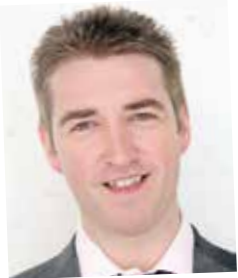
Vom Lehrling zur Leitung Inventur- und Bestandsmanagement; seit 1990 Kellner & Kunz