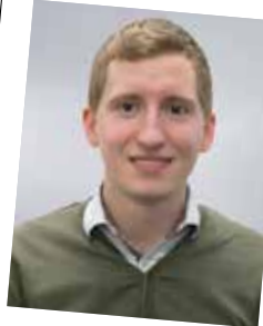
Vom Lehrling zum Produktmanager; seit 2004 Kellner & Kunz