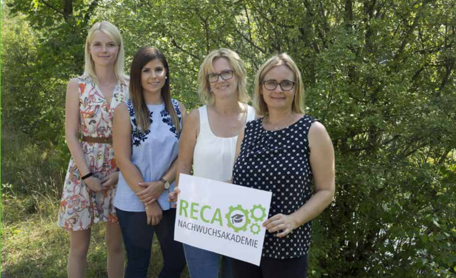
Kellner & Kunz Ausbildungsteam. Sehr viele MitarbeiterInnen sind nach ADA§29a BAG qualifiziert.