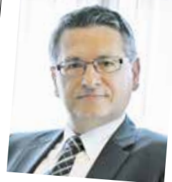
Vom Lehrling zum Top-Verkäufer, zum IT-/Dienstleistungsspezialisten, zum Sortiments-Industriecontroller; seit 1979 Kellner & Kunz