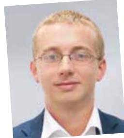
NAK-Absolvent 2008, Teamleitung CPS-Projektmanagement JWD CO & Stg, Lehrlingsausbilder