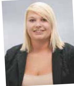
NAK-Absolventin 2014, Verkauf HW JDA