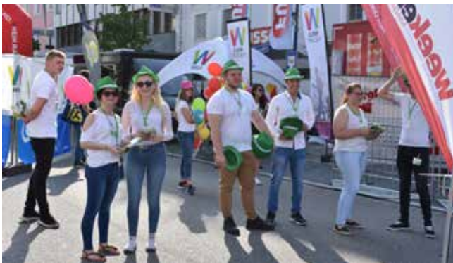
FestiWels: Event Employer Branding. Die Marke RECA wird aktiv von den Lehrlingen promotet.