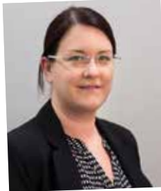
Vom Lehrling zur Operativen Einkäuferin, Team-Captain; seit 1994 Kellner & Kunz