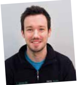
Der erste Absolvent Betriebslogistikkaufmann: Logistik-Controller