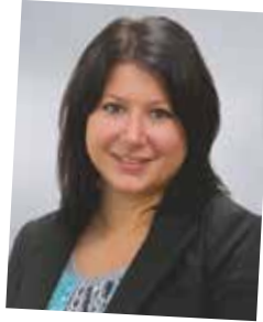
Eine der ersten NAK-Absolventinnen: Assistentin Kundenmanagement