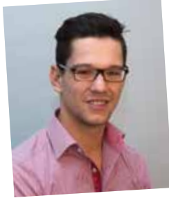
NAK-Absolvent 2012, Leitung Vertriebs-JW. CPS-Bedarfsplanung Reg. Stmk u. Kärnten Divi JWD