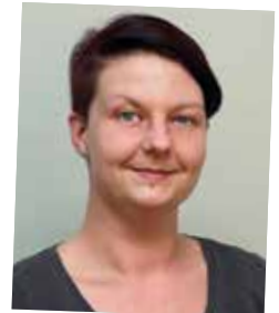
Vom Lehrling zur Spezialistin im Innendienst Industrie Verkauf; seit 2000 Kellner & Kunz