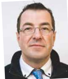
Vom Lehrling zum Logistik-Leiter-Stellvertreter; seit 1982 Kellner & Kunz