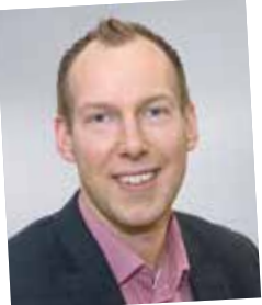
Einem der ersten NAK-Absolventen: Top-Industrie-Verkäufer