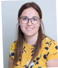
NAK-Absolventin 2011, Einkaufsdisponentin und Lehrlingsausbilderin