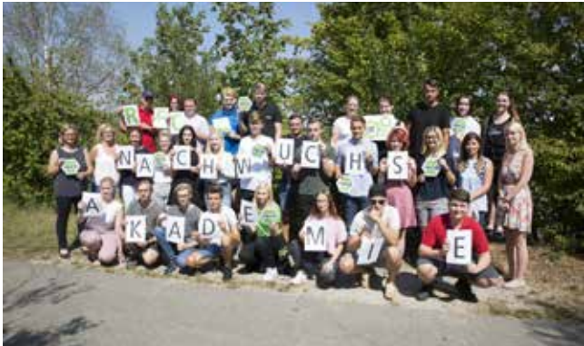
Fotoshooting: Auch der Spaß darf nicht zu kurz kommen!